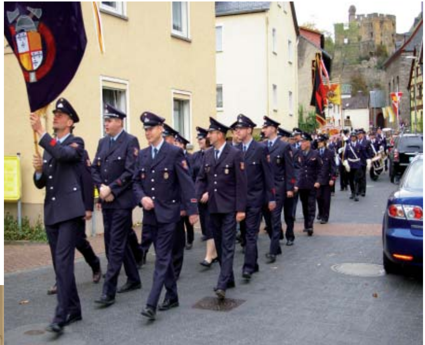
Festumzug am Sonntag nach dem Festgottesdienst