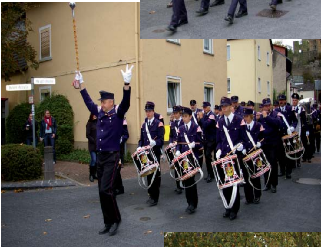
Der Spielmanns- und Fanfarenzug der Feuerwehr Überlingen in Aktion