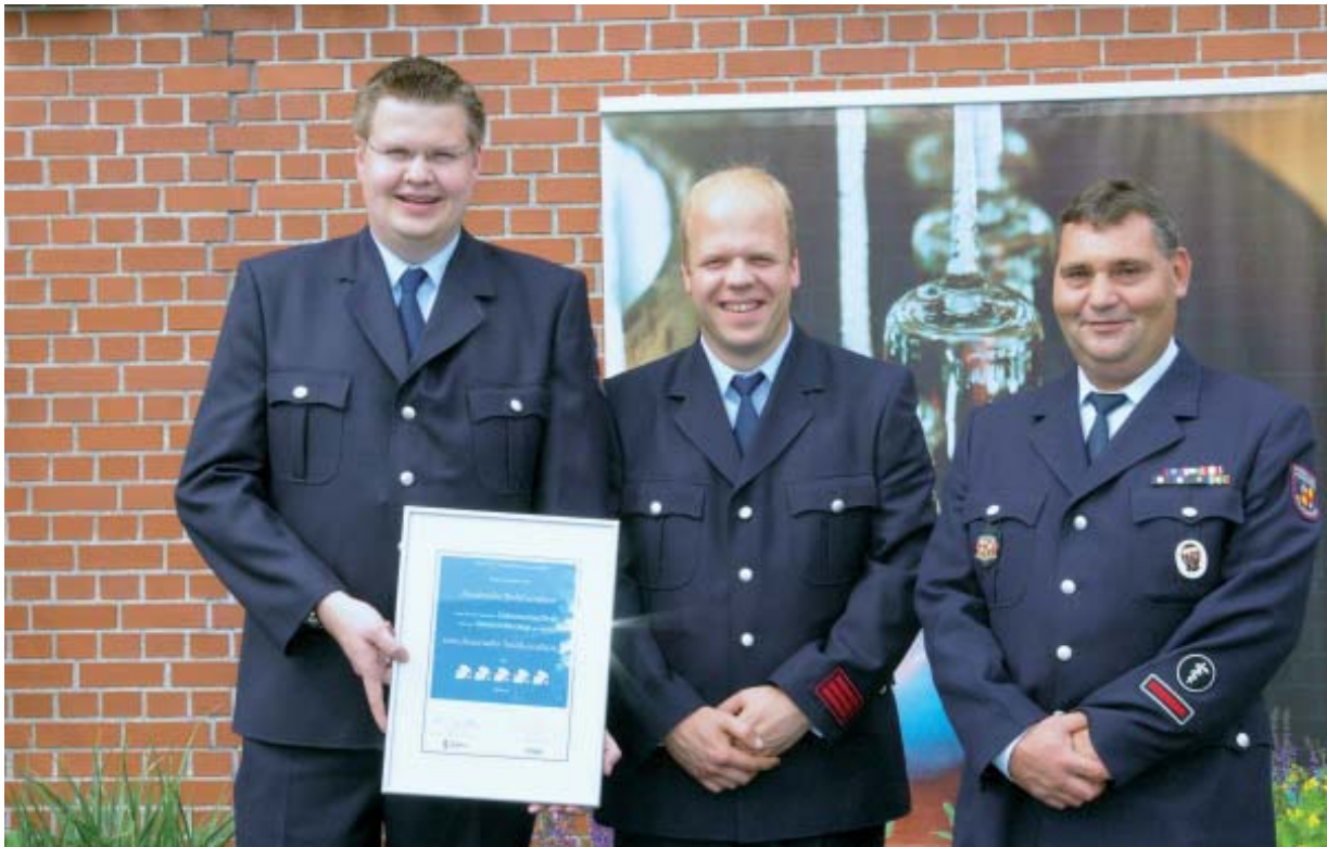
Die Abordnung unserer Wehr vor dem Deutschen Feuerwehrmuseum in Fulda.

Gewinner des Wettbewerbs, der unter der Schirmherrschaft des Deutschen Feuerwehrverbandes (DFV) steht, ist die Freiwillige Feuerwehr Roßdorf aus Hessen. Sie freuen sich über den Hauptpreis (Reise nach New York inkl. Teilnahme an der berühmten Steubenparade).